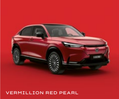
VERMILLION RED PEARL