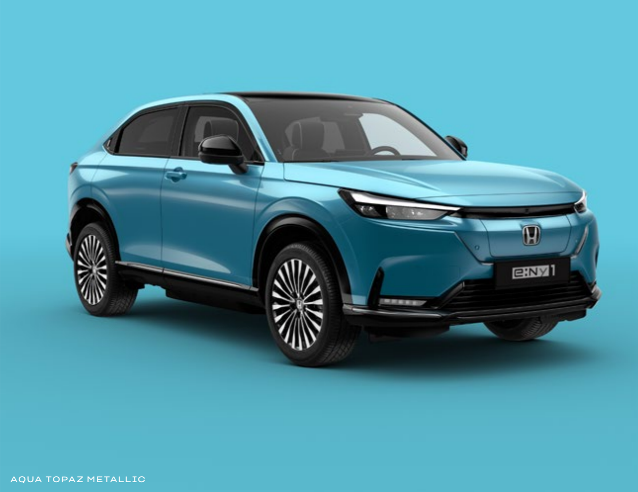
AQUA TOPAZ METALLIC

Scegli tra una gamma di colori contemporanei che riflettono la tua personalità e il design dinamico del nuovo e:Ny1.